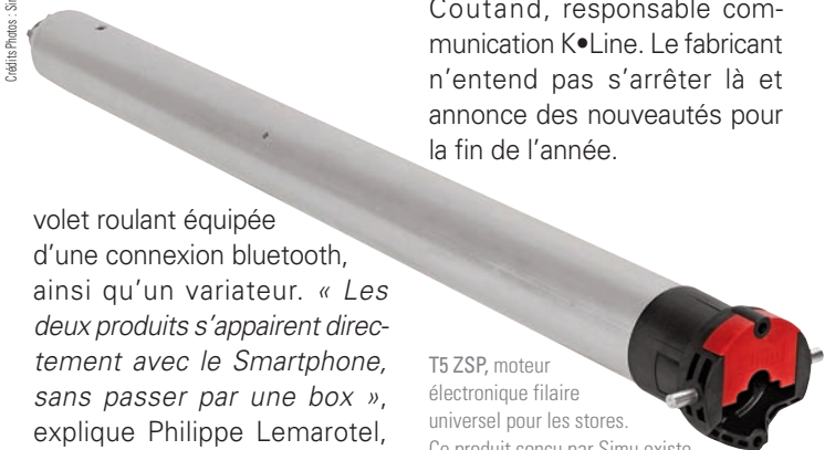
T5 ZSP, moteur électronique filaire universel pour les stores. Ce produit conçu par Simu existe aussi en version radio compatible avec les automatismes Hz

volet roulant équipée d'une connexion bluetooth, ainsi qu'un variateur. « Les deux produits s'appaireront directement avec le Smartphone, sans passer par une box », explique Philippe Lemarotel, directeur marketing de l'offre Hager France.