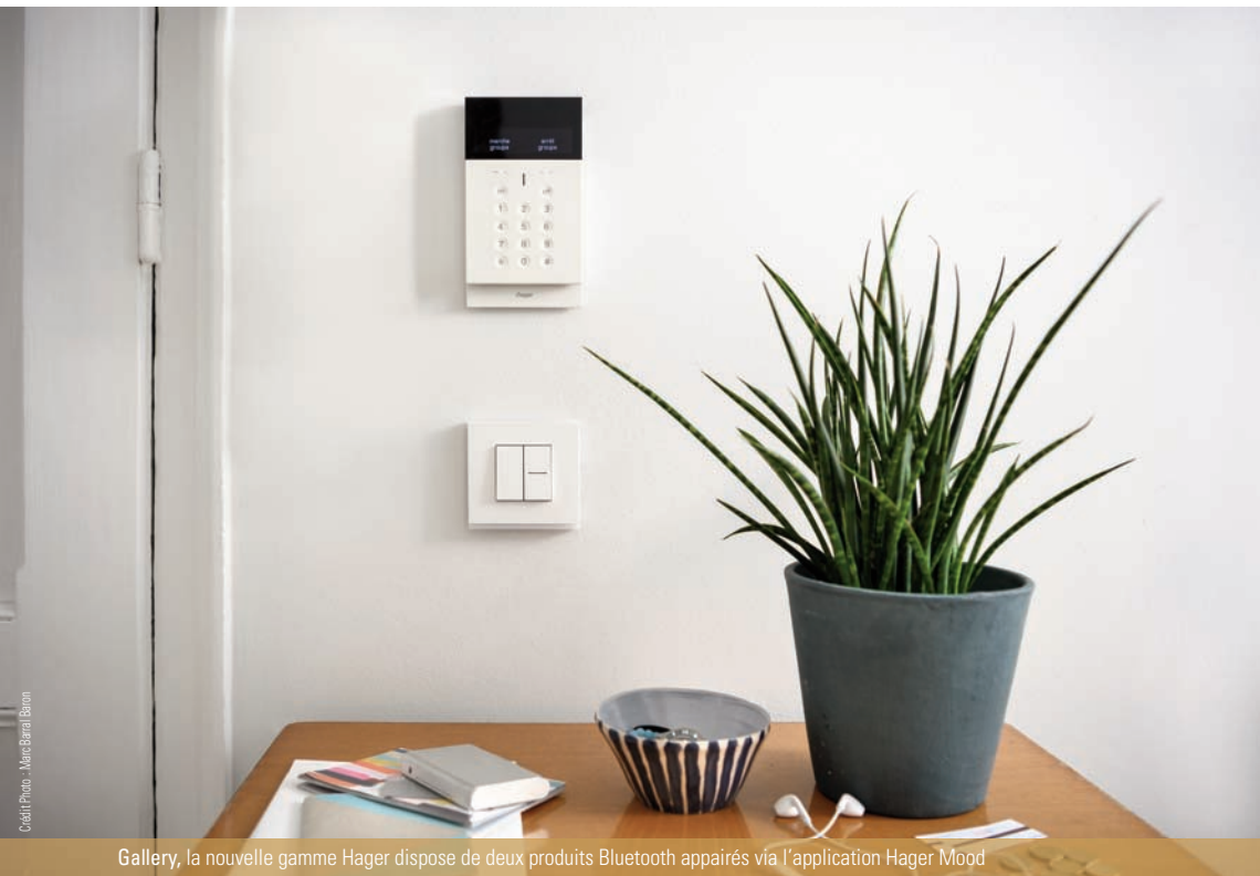
Gallery, la nouvelle gamme Hager dispose de deux produits Bluetooth appairés via l'application Hager Mood