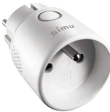
En associant la prise BHz à la box LiveIn2, piloter sa lumière loin de chez soi devient possible, ainsi que de la programmer pour qu'elle s'allume et s'éteigne automatiquement aux heures souhaitées - Simu

Hager qui commercialise en juin une nouvelle gamme d'appareillage mural Gallery (interrupteurs, prises, détecteurs, etc.), apporte une commande de